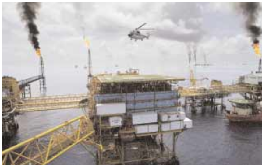
Ölplattform im Golf von Mexiko, hier wird Öl bis in Tiefen von über 1500 Metern gefördert.

Das Foinaven-Feld westlich der Shetlands, erst 1992 entdeckt, liegt rund 500 Meter unter dem Meeresspiegel. Bei solchen Wassertiefen wird oft auf so genannte schwimmende Förder- und Produktionseinheiten zurückgegriffen. Diese aber gelten laut Shell als „relativ stark wetterabhängig“ – in einer Region nahe der Shetlands, in der von Oktober bis April ein Sturmtief das nächste jagt, also ein riskantes Unterfangen. Kommt es zu einem Unfall, könnte der Ölteppich innerhalb von 48 Stunden die Shetland- und die Orkney-Inseln erreichen. Nicht nur die berühmten Vogelreservate, sondern auch die wirtschaftliche Zukunft der Inselbewohner – basierend auf Fischerei, Lachszeit und Tourismus – wäre dann bedroht.